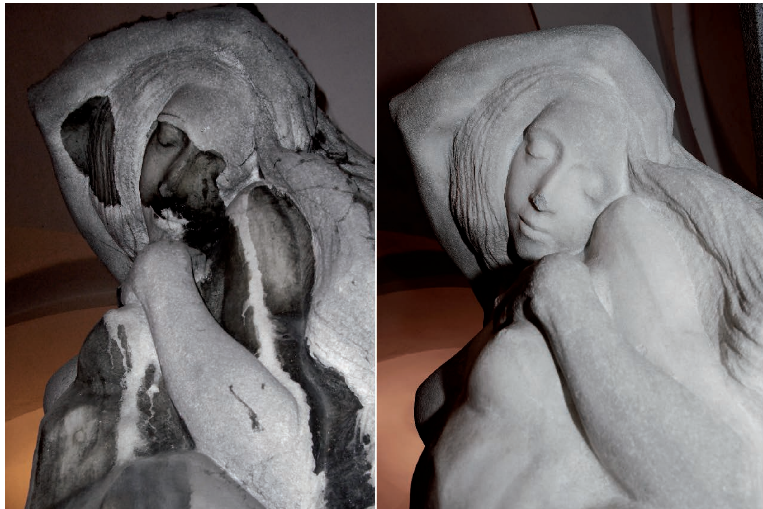
Intervento di restauro eseguito da Eleonora Gioventù e Micro4you S.r.l.